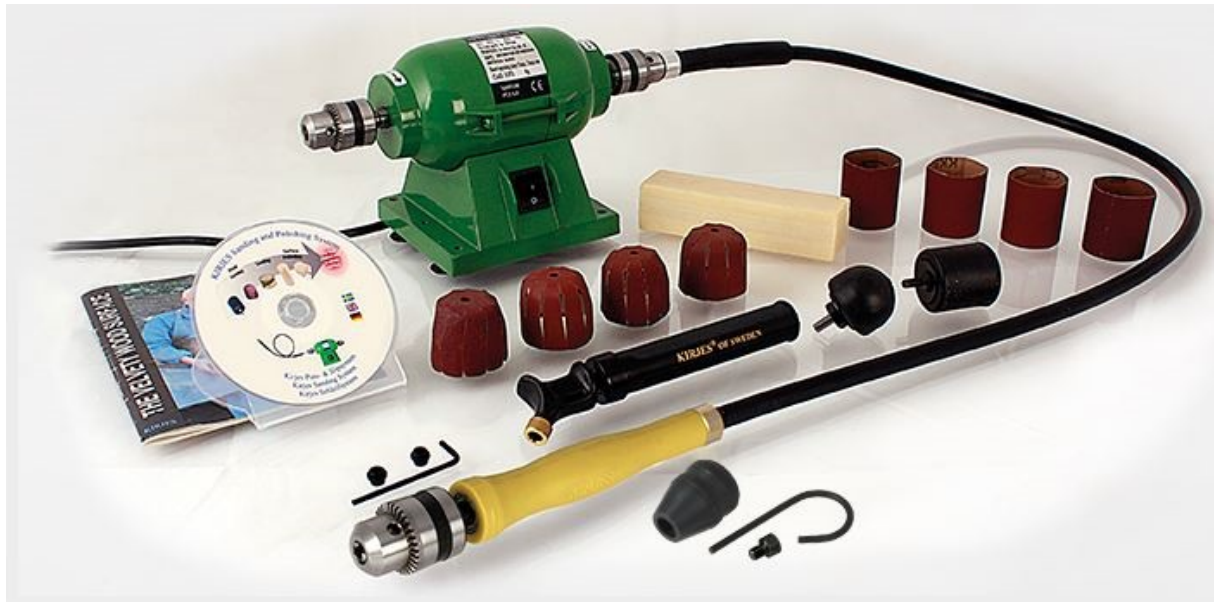
BASIC Schleif System, KJ140K-230, Fr. 368.00