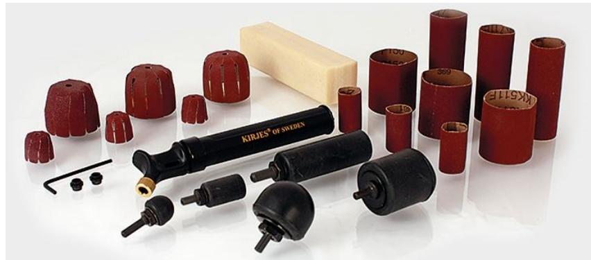
PROFI Schleifset, KJ101, Fr.368.00