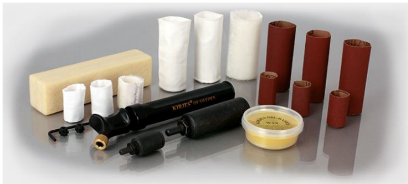
PROFI Schleif-Polierset, KJ120130P, Fr. 148.00