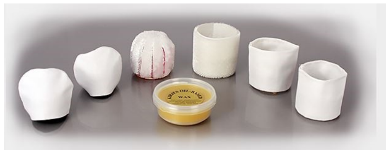
Polierset KJ908, Fr.55.00