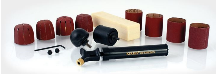
BASIC Schleifset, KJ140R140, Fr. 138.00